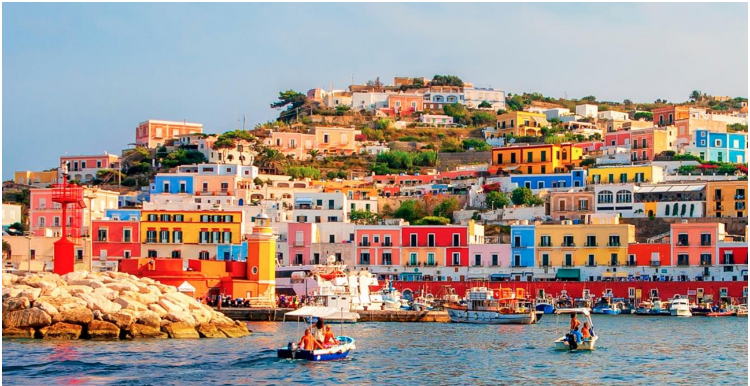
Isola di Ponza